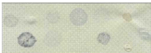
(rys. nr 2)