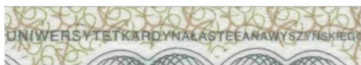
(rys. nr 3)