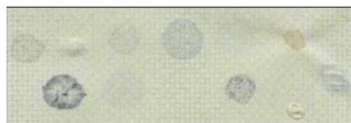
(rys. nr 2)