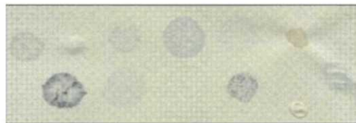
(rys. nr 2)